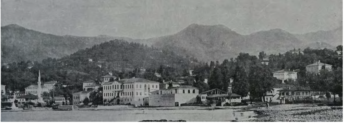
EK 2-3. 1920'lerde Rize panoraması