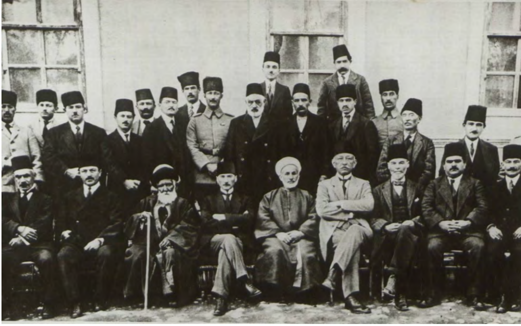
EK 2. M. Kemal Sivas'ta bazı Kongre delegeleri ile