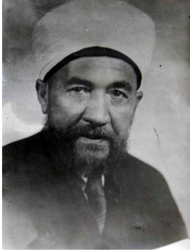
EK 1. Ahmet İzzet Efendi