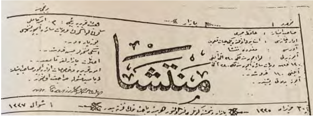
Resim 4. Menteşe gazetesinin 30 Haziran 1919 tarihli sayısı.