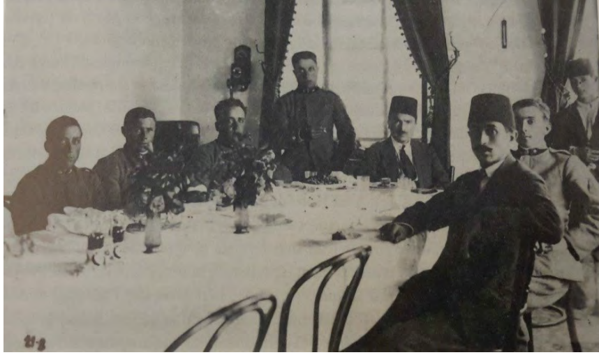
Resim 2. Muğla'nın ileri gelenleriyle İtalyan komutanlar yemekte. (Cecini, Il Corpo di Spedizione, s. 117.)