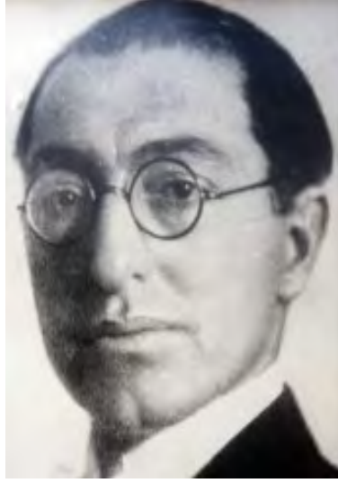
Resim 5. TBMM'de I. Dönem Menteşe Mebusu Tefik Rüşdü (Aras)

Meclis-i Mebûsan ve Türkiye Büyük Millet Meclisi'nde bu kadar çok mebusun bulunmasıyla ilgili bir açıklama yapmalıyız. Kayıtlara göre Türkiye Büyük Millet Meclisi için yapılan seçimleri beş mebus kazanmıştır. Ancak bunlardan bir kısmı Meclis gelemenden, bazıları Mecliste göreve başladıktan sonra istifa etmiştir. Seçilen mebuslar arasında şehit olanlarla görevi başında vefat edenler de bulunmaktadır. Çeşitli nedenlerle mebusluktan ayrılanların yerine yenileri seçildiği için Menteşe mebuslarının sayısı fazlamış gibi görünmektedir. 146