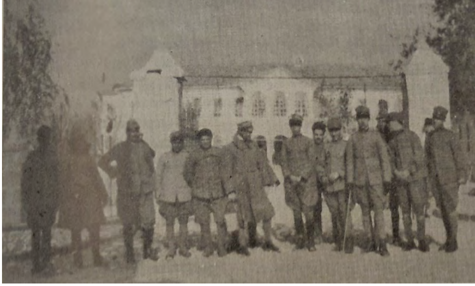
Resim 1. Burdur Hükûmet Konağı önünde işgalci İtalyan askerleri

sevk etmek gayesiyle geri çektiklerini belirtmektedir. 24 İtalyanları böyle davranmaya yönelten etkenlerin başında, Yunanlarla olan menfaat çatışması gelmiş olabilir. Zira İtalyanlar gizli antlaşmalarla kendilerine vadeliden Batı Anadolu'nun Yunanlara verilmek istenmesini hazmedememektedir. Buradaki Yunan menfaatlerine engel olmak ve Batı Anadolu'da kendi nüfuzunu artırabilmek için bu bölgeye kuvvet sevk etmektedir.