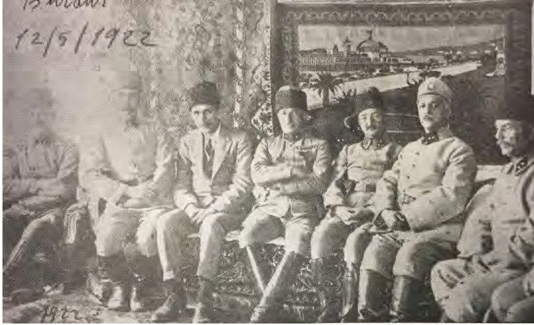
Resim 6. Ali İhsan (Sabis) Paşa Burdur'daki askerî kurumları ve hastaneyi denetiminde 12.05.1922 (Sabis, Harp Hatıralarım, s. 240)