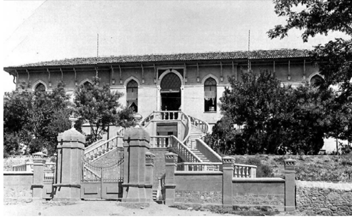
Resim 12. Atatürk'ün ziyaret ettiği Denizli Memleket Hastanesi ( https://www.denizligazetesi.com/guncel/husamettin-atamanin-kaleminden-ataturkun-denizliye-gelisi-h-78522.Html (e.t. 13.09.2022))