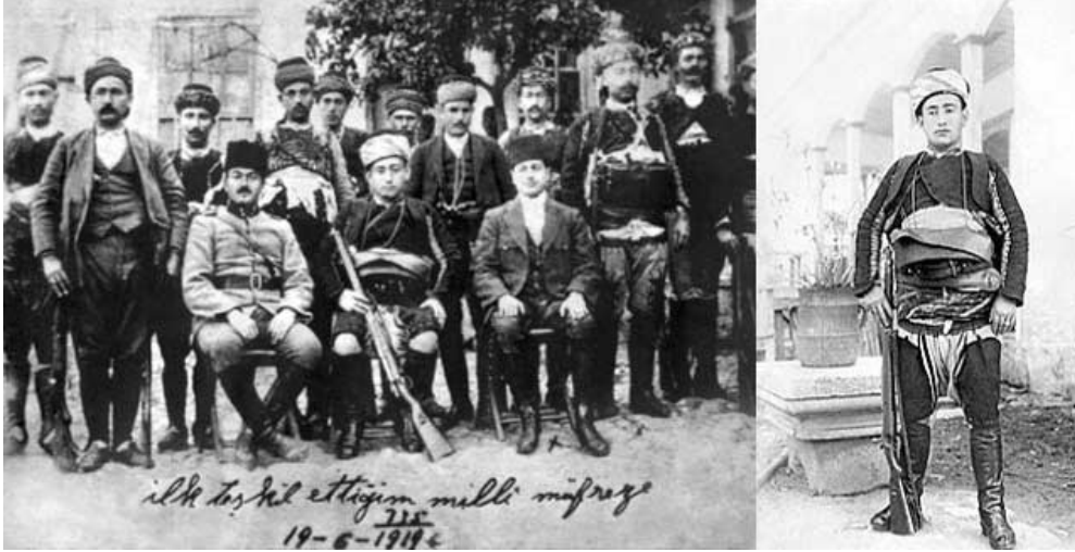
Resim 9-10. Yörük Ali Efe ve Yörük Ali Efe ilk oluşturduğu millî müfreze (19.06.1919)

Efe Mücahitleri (152), Kuyucak Mücahitleri (37), Akçaköy Mücahitleri (50), Tavas Yıldırım Mücahitleri (206), Ortakçı Mücahitleri (28), İsmail Efe Mücahitleri (358), Zurnacı Efe Mücahitleri (49), Pirlibeğ Mücahitleri (54). Toplam Mücahit: 2900.