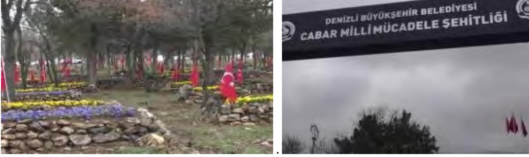
Resim 1-2. Cabar Şehitliği ( https://www.civril.bel.tr/cabar-sehitligi-cabar-mahallesi erişim tarihi: 01.09.2022)

Takip eden aylarda Yunan kuvvetleri Çivril'e yeniden taarruza geçtiler. İlk işgalden yaklaşık üç ay sonra 14 Nisan'da Çivril tekrar işgal edildi. 11 Yunanların bu ikinci işgalleri uzun sürdü. Çivril ancak 30 Ağustos 1922'de düşmandan kurtarıldı. Bu işgal süresinde Yunan askerlerinin pek çok mezâlimi oldu. İşgalci Yunan askerleri Çivril'in Cabar köyünü yaktı ve köy halkından 83 canı şehit ettiler. Bu katliam ve bölgedeki Yunan mezalimi halkta derin izler bıraktı, ağıtlar yakıldı. 12 Yine Yunan'ın işgal ettiği Sarayköy'ün bazı köylerinde de çeşitli katliamlar ve zulümler yaşandı. İşgal süresince 220 kadar masum Türk katledildi, 30 kadar kadın ve genç kıza tecavüz edildi, çeşitli yağma ve gasp olayları yaşandı. Yunanlar, Sarayköy'e bağlı, Köprübaşı, Karataş, İhsaniye, Karaağaç köylerinde okul ve camiler dâhil 150 civarında evi yakıp yıktılar, pek çok mal ve eşyayı yağmaladılar, gasp ettiler ve bun benzer olaylar Çal'ın bazı köylerinde de yaşandı. 13