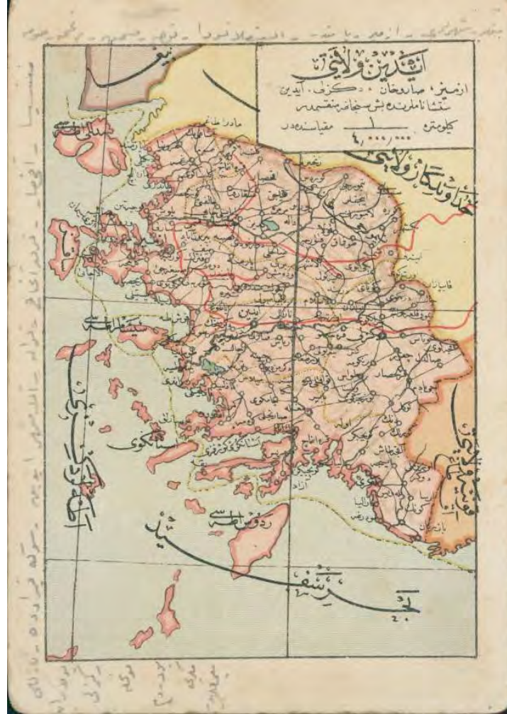
EK 1. Aydın Vilayeti Haritası (İstanbul Büyükşehir Belediyesi Atatürk Kitaplığı, Krt_028321)